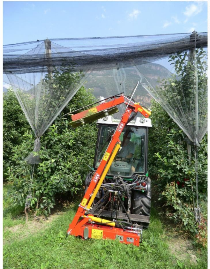
Baumspitzen-Schnitt unter Hagelnetze

Feintaster mit Federzug Schnittbreite 75 cm Vertikale Verstellung 90 Grad für Laubwand-Schnitt 2,75 m Hagelnetz-Schutz verstellbar Abnehmbare vertikale Balken für nur Baumspitzen-Schnitt