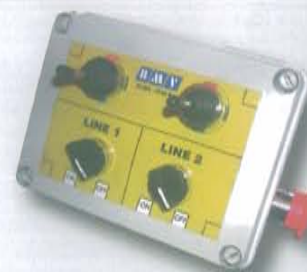
Caja de mando o joystick combinado con distribuidor electrohidráulico