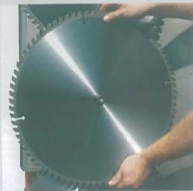
DISCOS para cortes hasta 10-12 cm. de diámetro

Unidad hidráulica independiente de 80 Lt con grupo bomba Multiplicador Filtro Radiator para el resfrío Ataque a 3 puntos