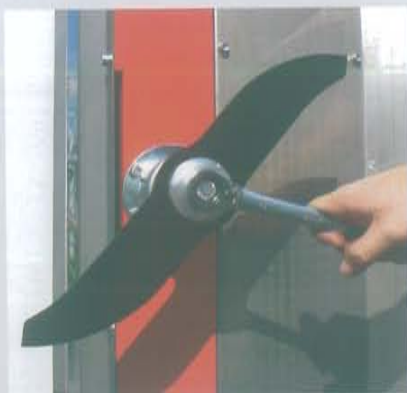
CUCHILLO para cortes hasta 2-3 cm. de diámetro

Anchura mínima de corte mt 1,40 Ensanche hasta mt 2,10