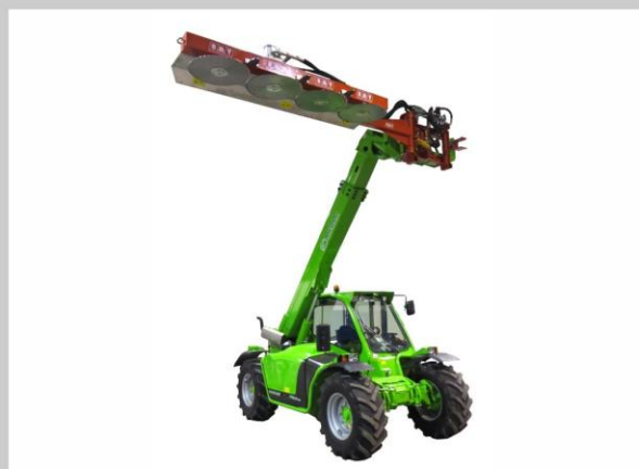
Pistone per inclinazione 115° barra di taglio