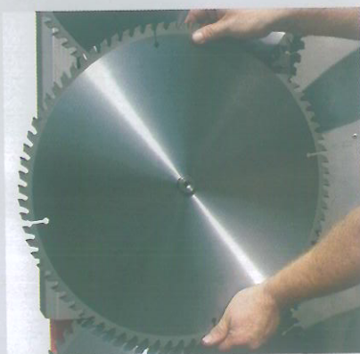
DISCO per tagli sino a 10 ÷ 12 cm di diametro

Centralina idraulica indipendente da 80 Lt con gruppo pompa Moltiplicatore Filtro Radiatore per raffreddamento Attacco tre punti