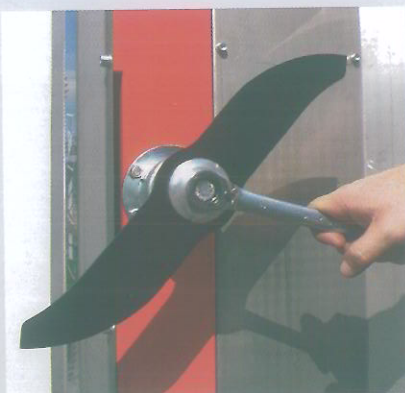
COLTELLO per tagli sino a 2 ÷ 3 cm di diametro

Larghezza minima di taglio mt 1,40 Allargamento fino a mt 2,10